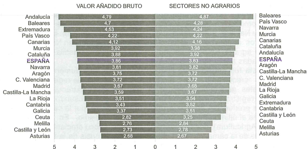
GRÁFICO NÚM. 2 CRECIMIENTO DEL PIB POR COMUNIDADES AUTÓNOMAS

Año 1997 (Tasas de crecimiento real del VAB)